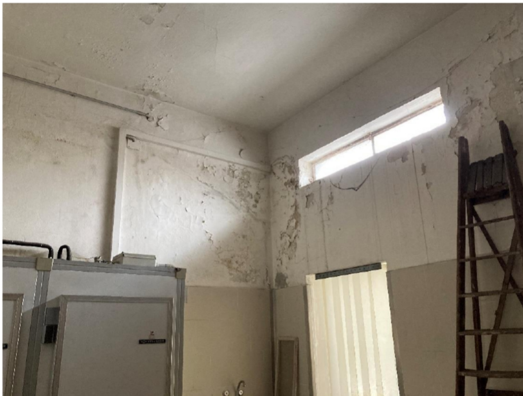
Foto n. 5: visuale generale ammaloramenti alle pareti e al soffitto – locale principale.