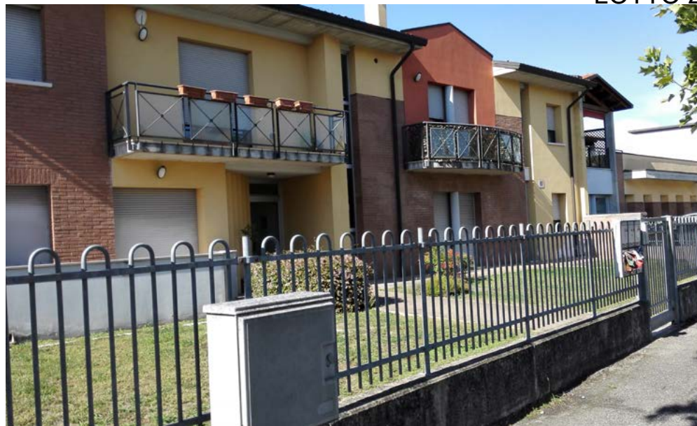
Prospetto Ovest, accesso pedonale da via Marconi.