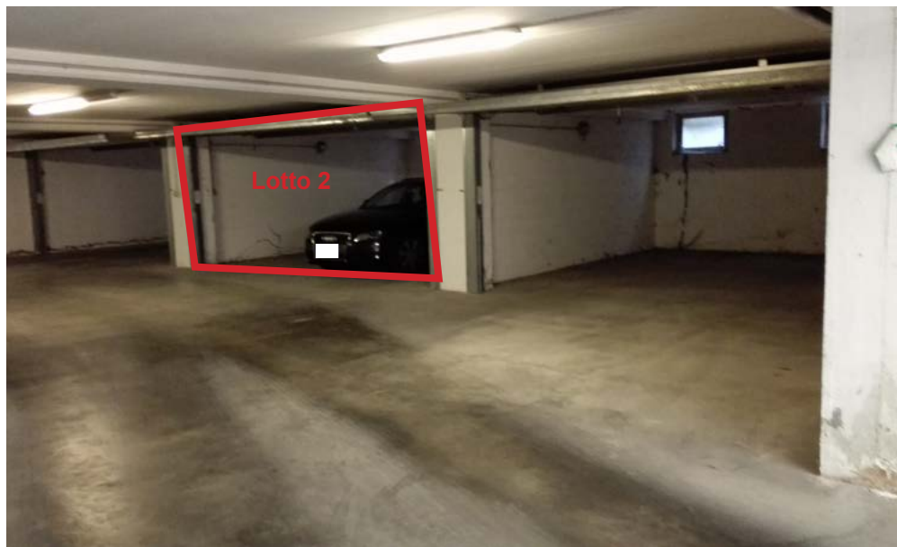
Area di manovra, autorimessa piano interrato.