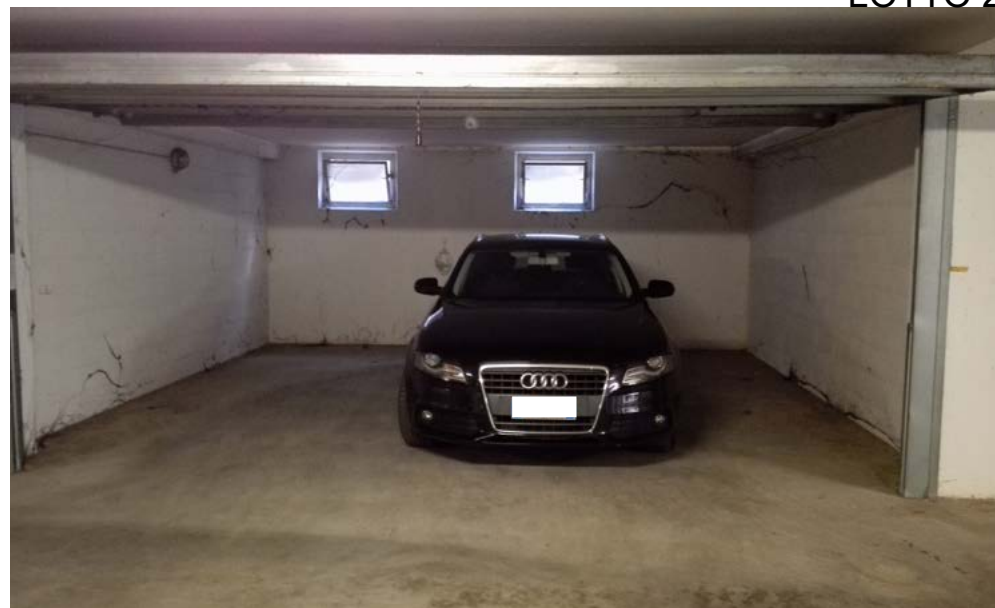
Garage, piano interrato lotto 2.