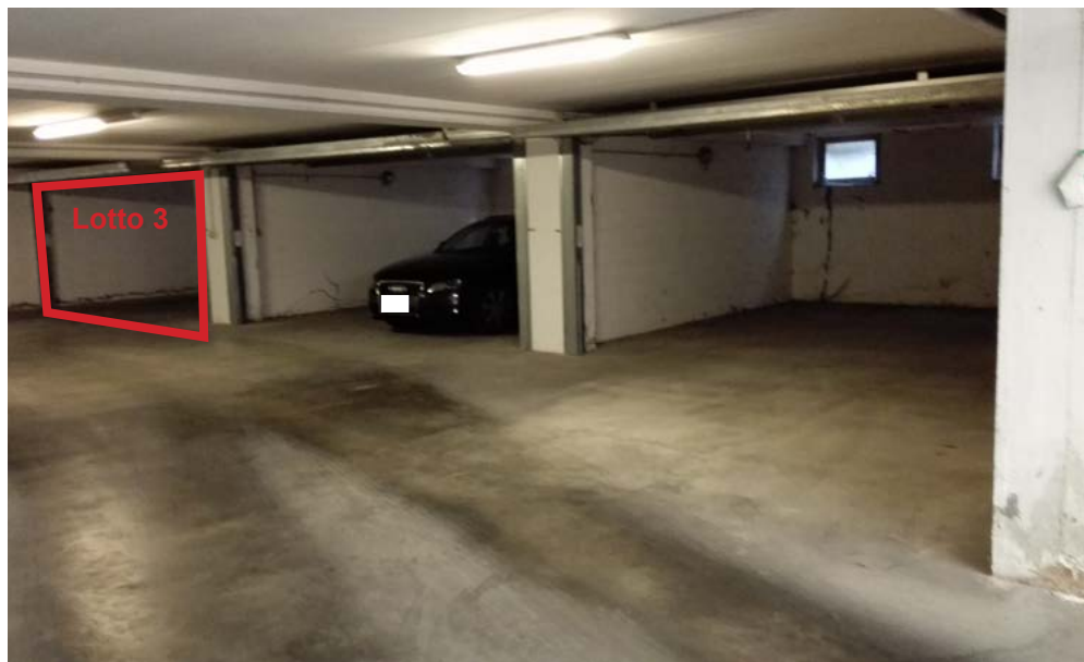
Area di manovra, autorimessa piano interrato.