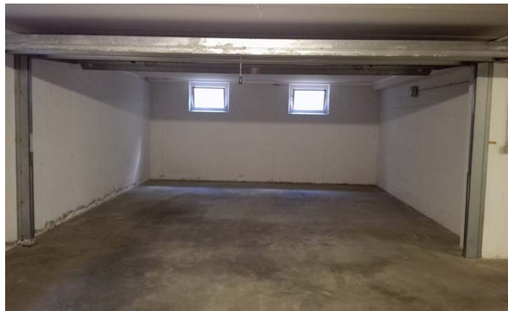
Garage, piano interrato lotto 3.