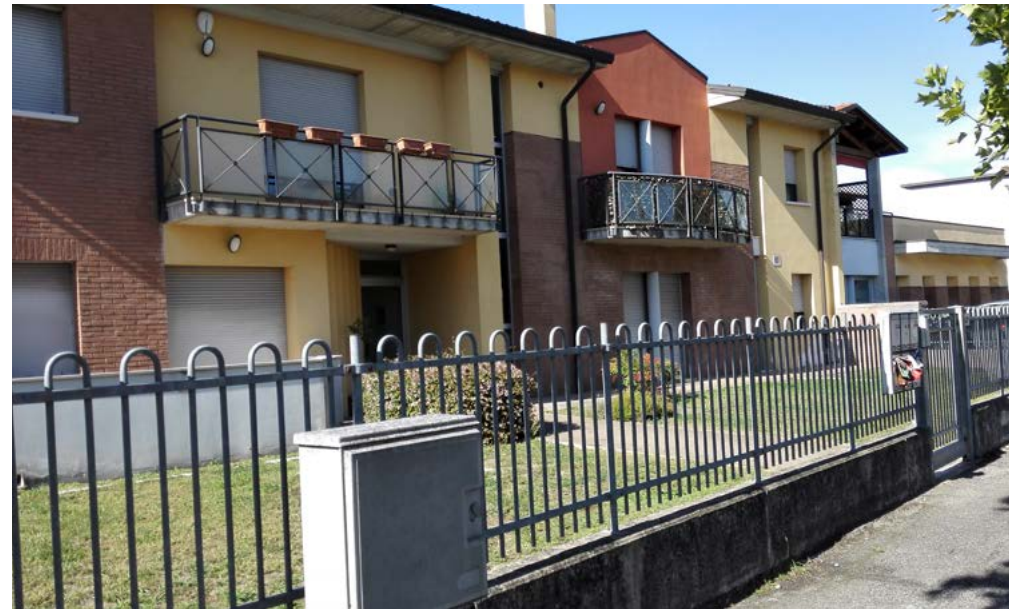
Prospetto Ovest, accesso pedonale da via Marconi.