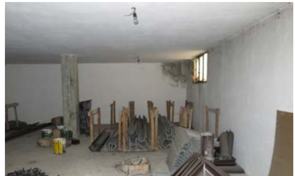
Locale di deposito, piano interrato lotto 10.