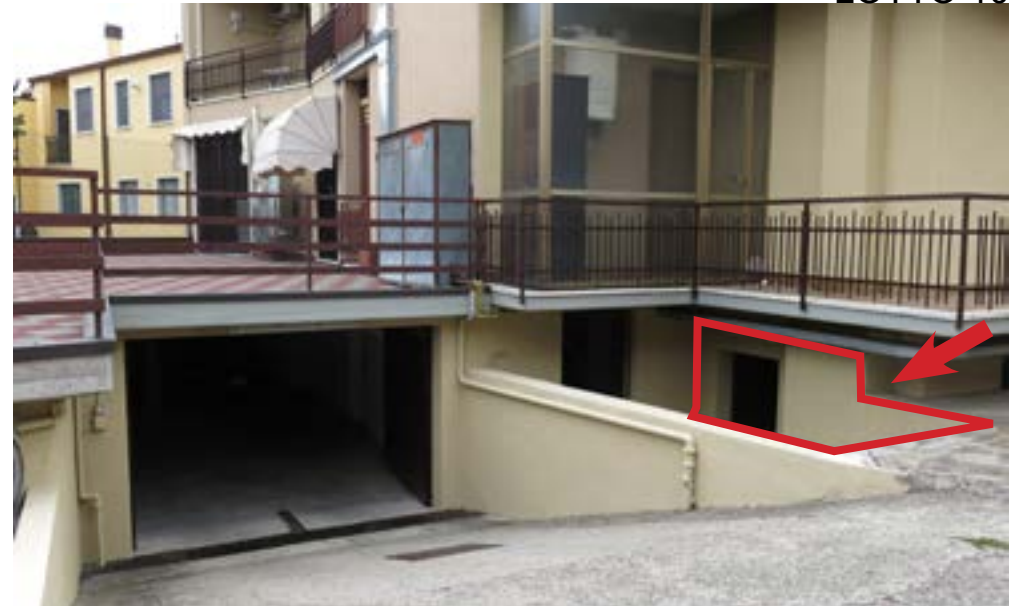
Porzione del prospetto Sud, accesso al piano seminterrato.