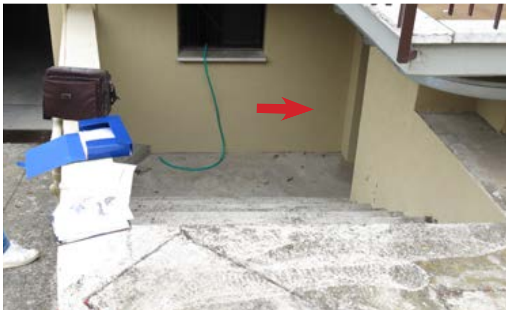
Scala di accesso al locale scantinato, lotto 10.